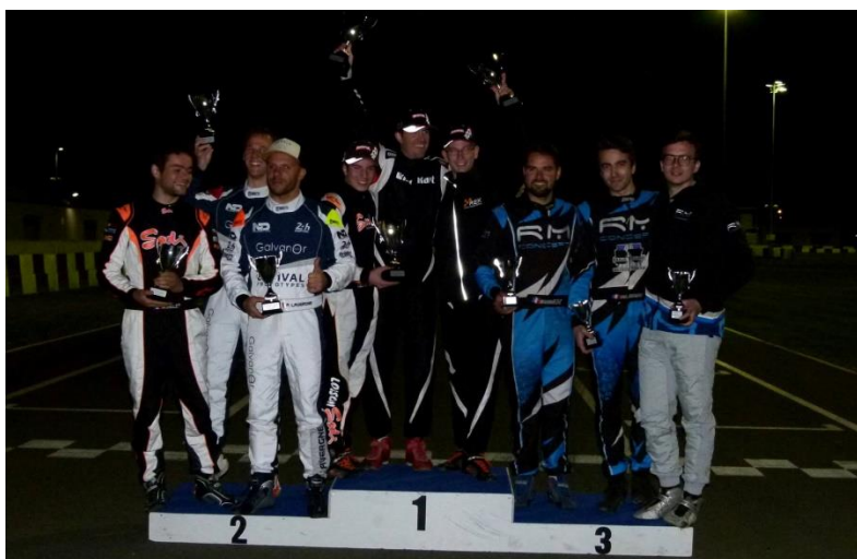
6H du MANS 2017 - Podium GP2