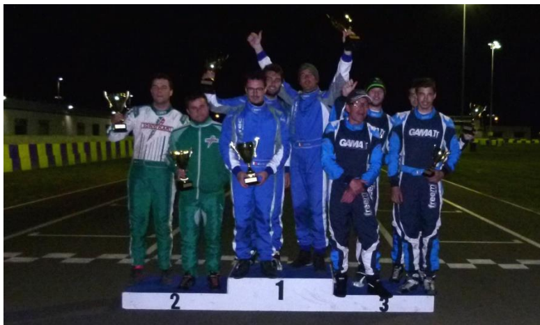
6H du MANS 2017 - Podium GP1