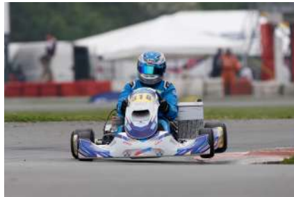
X30 Senior Cup / F-X. Venet