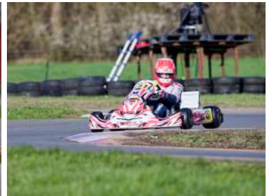
X30 Master / N. Chapelle