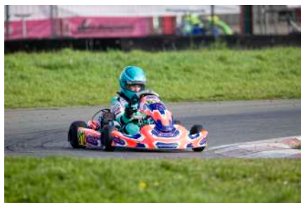
Mini / L. De Cock / © P.Verheuge