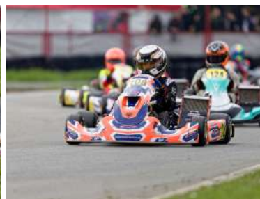
X30 Junior / D. Hagelen