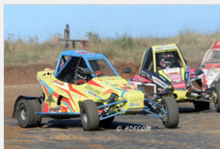
Thomas MAULNY (ROSCROSS) s'impose comme la nouvelle référence en Super Sprint

Les cinq catégories du Championnat de France d'Autocross et de Sprint Car étaient toutes plus impressionnantes les unes que les autres. Chacune des manches qualificatives obligeait les quelques 5000 spectateurs amassés sur les abords du circuit à retenir leur souffle.