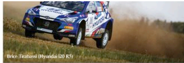
Brice Tirabassi (Hyundai i20 R5)