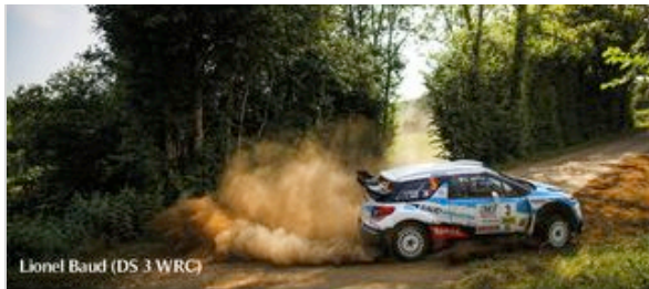
Lionel Baud (DS 3 WRC)