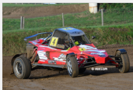
Theo LAVENU pourrait bien profiter de l'effet nouveauté pour s'imposer

Enfin nous y voilà, cette épreuve tant attendue arrive à grand pas. En effet, les organisateurs de l'ASA Terre 67 portés par la famille STARK travaillent d'arrache-pied depuis des mois pour mettre sur pied leur épreuve qui intègre pour la première fois le calendrier de la Coupe de France