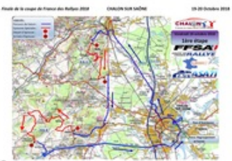
CARTE ÉTAPE 1