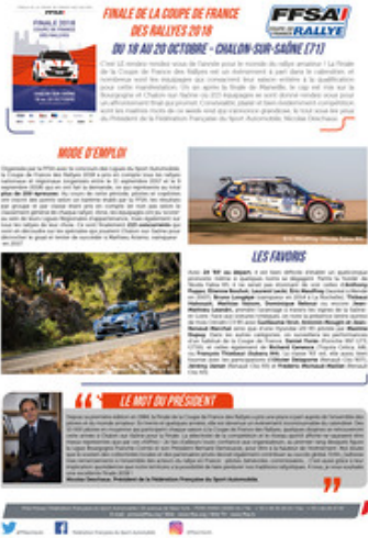
LETTRE DE PRÉSENTATION