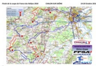
CARTE ÉTAPE 2