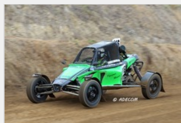
Thomas CHRISTOL va-t-il réduire encore l'écart ce weekend?

Alors que l'on entame clairement le dernier quart de la saison, les places pour le championnat ne sont pas encore figées et tout reste possible pour les pilotes. Cette épreuve d'Is sur Tille, toujours aussi spectaculaire, nous réservera encore un spectacle époustouflant.