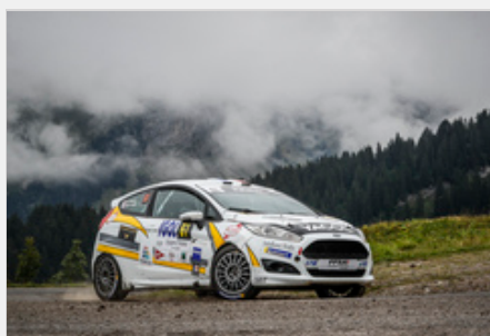
Victor Cartier au Rallye du Mont-Blanc Morzine 2019.

Sur les routes sinueuses cévenoles, un parcours de près de 600 km, dont 192,33 chronométrés, sera leur terrain de jeu pour décrocher le titre tant convoité et accompagné d'un programme pour la saison 2020.