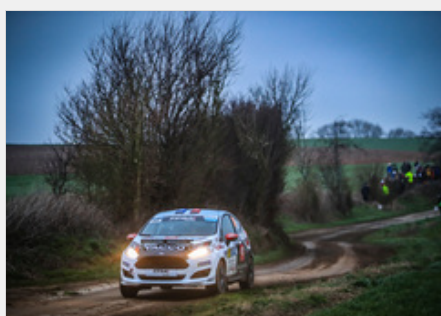
CFRJ - Rallye Le Touquet Pas-de-Calais

Les jeunes pilotes, plus ou moins expérimentés, devront composer au volant de Fiesta 2 RJ sur les routes piégeuses et dans les conditions météorologiques souvent difficiles de ce rallye.