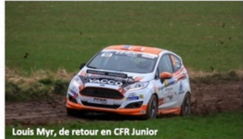
Louis Myr, de retour en CFR Junior

• 7 ligues seront représentées pour cette première manche 2020 : PACA (7) – Hauts de France, Nouvelle Aquitaine, Rhône Alpes, Occitanie (2) - Corse, Grand Est (1)