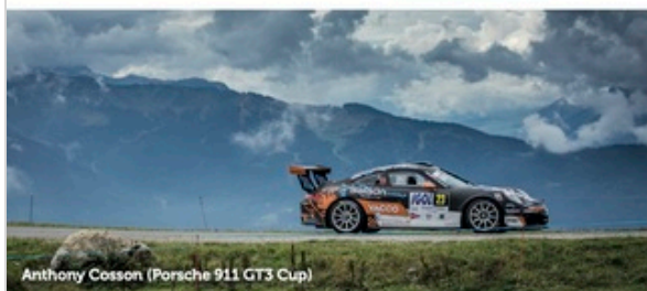
Anthony Cosson (Porsche 911 GT3 Cup)

Les horaires seront annoncés chaque matin sur la page Facebook.