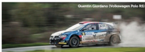
Quentin Giordano (Volkswagen Polo R5)

Afin d'assurer la sécurité de tous, merci d'appliquer les gestes barrières et de respecter les protocoles sanitaires recommandés de la FFSA.