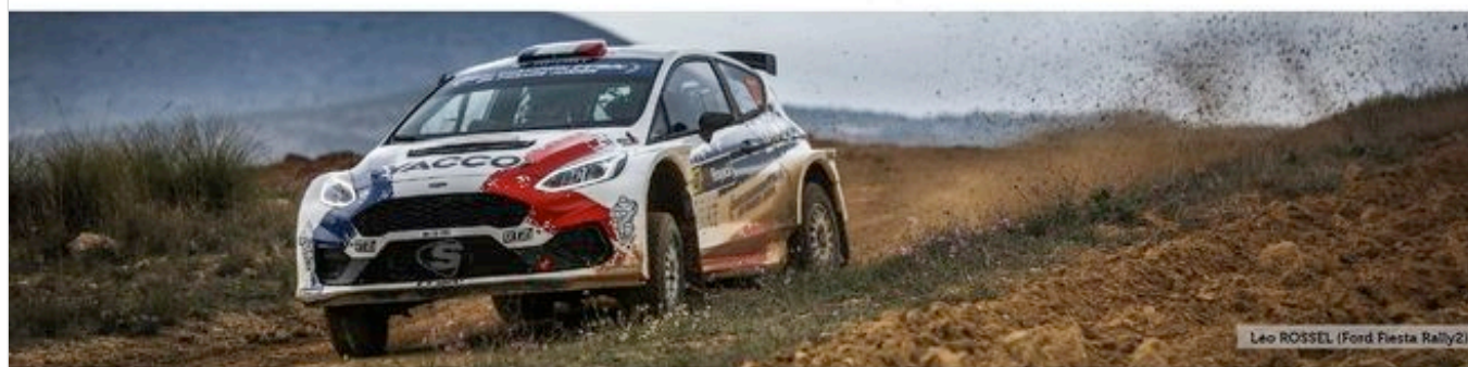
Léo ROSSEL (Ford Fiesta Rally2)

Comme pour les 'modernes', les concurrents du Trophée Fédéral VHC Terre - Rétro Assurances / Art et Création ont dû ronger leur frein depuis septembre dernier ... au Castine ! Ils seront 21 engagés pour cette première manche avec des voitures qui feront rêver les jeunes et les moins jeunes à n'en pas douter : Porsche 911, Toyota Celica GT4, Lancia Delta HF Intégrale, Citroën Visa 1000 pistes, Peugeot 309 GTi entre autres !