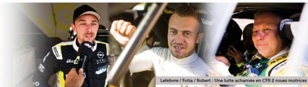
Lefebvre / Fotia / Robert : Une lutte acharnée en CFR 2 roues motrices

Le Rallye Aveyron Rouergue Occitanie est organisé par l'ASA Rouergue