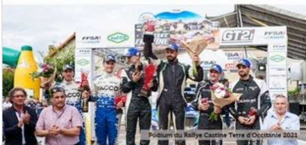
Podium du Rallye Castine Terre d'Occitanie 2021

Mais aussi la Radio du CFRT en direct sur l'application « FFSA Live », et fr-medialive.com !